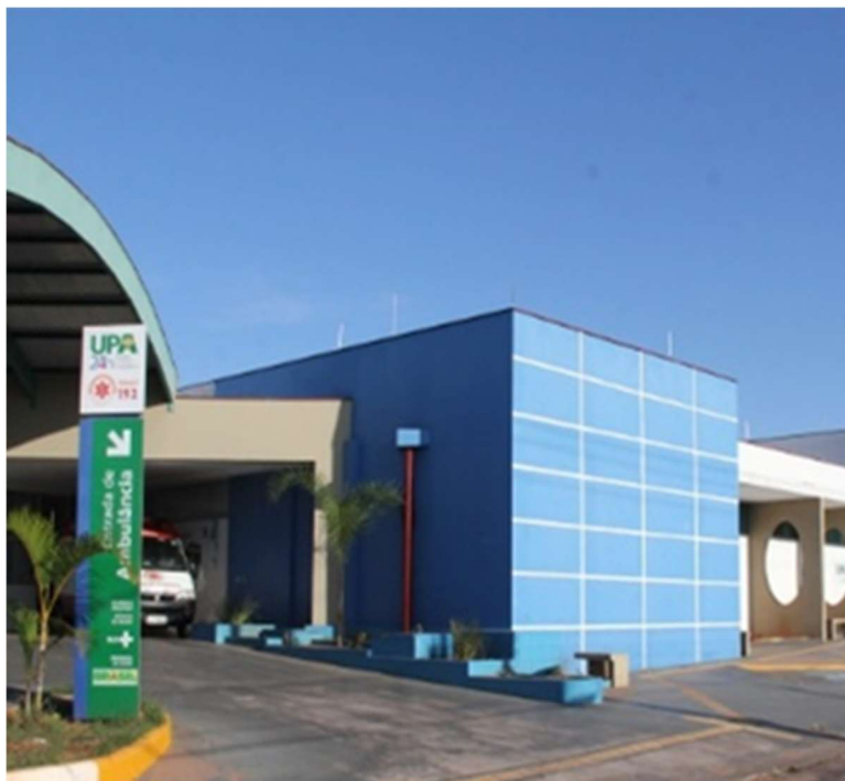
Foto – Fachada da Unidade de Pronto Atendimento (UPA) IPIRANGA

DESCRIÇÃO DA UNIDADE UPA 24hs IPIRANGA - Unidade de Pronto Atendimento – UPA Porte III e SERVIÇO DE GESTÃO DE PLANTÕES MEDICOS NA UNIDADE PRESTADO PELA FUNDAÇÃO ESTATAL REGIONAL DE SAÚDE DA REGIÃO DE BAURU - FERSB