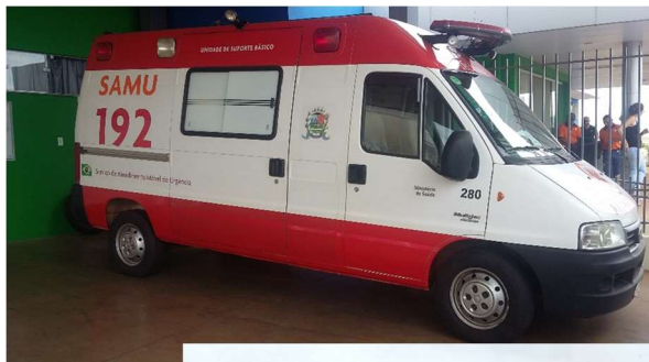
Foto: Automóvel SAMU – Serviço de Atendimento Móvel de Emergência.

O atendimento do SAMU 192 começa a partir do chamado telefônico, quando são prestadas orientações sobre as primeiras ações. O serviço pode ser acessado gratuitamente pelo número 192, a partir de qualquer telefone, fixo ou móvel. A ligação é atendida por técnicos, que identificam a emergência e coletam as primeiras informações sobre as vítimas e sua localização. Em seguida, as chamadas são remetidas ao Médico Regulador, que presta orientações às vítimas e aciona as ambulâncias quando necessário.