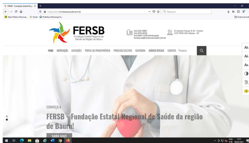
Imagem: Página inicial do site oficial da FERSB

Para os atos que assim são exigidos, a FERSB utiliza também publicação no Diário Oficial do município de Bauru - https://www2.bauru.sp.gov.br/juridico/diariooficial.aspx